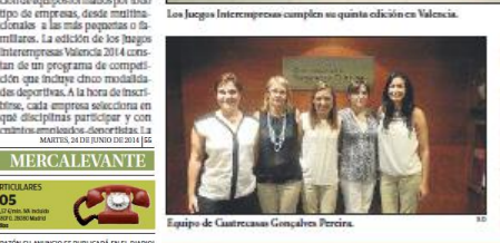
Equipo de Cuarenta y Cuatro Puntos.

Los Juegos Interempresas se han convertido ya en cinco en el calendario de competiciones de la ciudad de Valencia. Esta año completan su quinta edición en la capital de la Comunidad Valenciana. Los Juegos Interempresas, que se celebran en Valencia, Barcelona y Madrid, son una iniciativa que pretende acercar a los empresarios y a los deportistas, a través de la práctica de diferentes deportes. Los Juegos Interempresas, que se celebran en Valencia, Barcelona y Madrid, son una iniciativa que pretende acercar a los empresarios y a los deportistas, a través de la práctica de diferentes deportes.