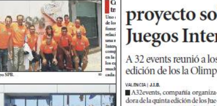
Equipo de Cuarenta y Cuatro Puntos.

Los Juegos Interempresas se han convertido ya en cinco en el calendario de competiciones de la ciudad de Valencia. Esta año completan su quinta edición en la capital de la Comunidad Valenciana. Los Juegos Interempresas, que se celebran en Valencia, Barcelona y Madrid, son una iniciativa que pretende acercar a los empresarios y a los deportistas, a través de la práctica de diferentes deportes. Los Juegos Interempresas, que se celebran en Valencia, Barcelona y Madrid, son una iniciativa que pretende acercar a los empresarios y a los deportistas, a través de la práctica de diferentes deportes.