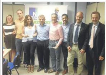
Entrega de la donación a Fundación Novaterra.