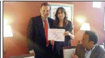
Intertech, proyecto solidario

La clasificación a la eficiencia deportiva recae en el equipo de la Universidad Politécnica de Valencia con 7,83 puntos, seguido de Capgemini con 5,67 y Schneider Electric con 4,90 puntos. El trofeo al espíritu deportivo fue para Co-