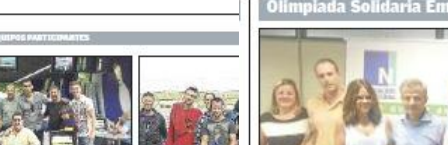
Los Juegos Interempresas completan su quinta edición en Valencia.

Se busca a la empresa más deportista Valencia acoge desde ayer la quinta edición de los Juegos Interempresas