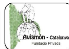
Fundació Avismón (2015)