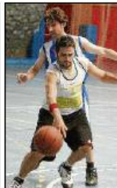
Imagen de la final.

una gran actividad con la disputa de fútbol 7, tenis, pádel y squash. En fútbol 7, la empresa Johnson Controls se proclamó campeona tras derrotar a Blumag. En tenis, venció Colebaga, en baloncesto Ferro Spain, en karts Schneider Electric España y la UPV se impuso en pádel y Squash.