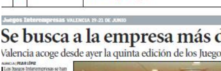
Los Juegos Interempresas completan su quinta edición en Valencia.

Se busca a la empresa más deportista Valencia acoge desde ayer la quinta edición de los Juegos Interempresas