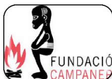
Fundació Campaner (2006-2007)