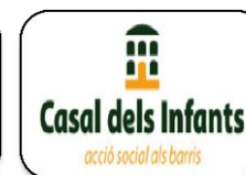
Casal dels infants (2010)