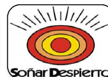
Fundación Soñar Despierto (2009)