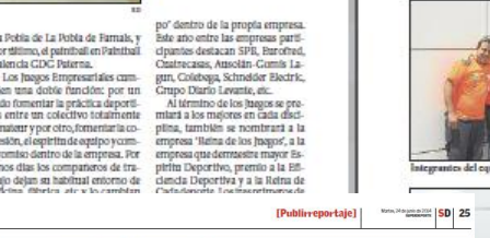
Equipo de Cuarenta y Cuatro Puntos.

Los Juegos Interempresas se han convertido ya en cinco en el calendario de competiciones de la ciudad de Valencia. Esta año completan su quinta edición en la capital de la Comunidad Valenciana. Los Juegos Interempresas, que se celebran en Valencia, Barcelona y Madrid, son una iniciativa que pretende acercar a los empresarios y a los deportistas, a través de la práctica de diferentes deportes. Los Juegos Interempresas, que se celebran en Valencia, Barcelona y Madrid, son una iniciativa que pretende acercar a los empresarios y a los deportistas, a través de la práctica de diferentes deportes.