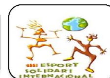
Esport Solidari Internacional (2009)