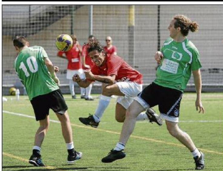
Las distintas disciplinas deportivas de la actual edición de los Jocs Interempreses 2010 cuentan con un gran número de participantes y un destacable nivel de juego.