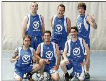
Ferro Spain se impuso en la competición de baloncesto.

La competición, que consta de un total de 9 modalidades deportivas distintas se desarrolla básicamente en las instalaciones de la Universidad Politécnica de Valencia. A lo largo de la jornada de ayer, el campus del politécnico registró