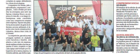
Grupo de participantes en la competición de la pelota valenciana.

Las empresas valencianas también tienen sus propios Juegos Olímpicos Valencia acoge del 19 al 21 de junio los Juegos Interempresas