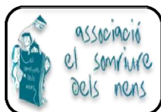
El somriure dels nens (2010)