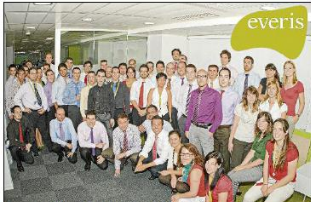
Empleados de Everis que participan en la Olimpiada Solidaria

La actividad deportiva se cerrará mañana domingo a las 14.00 horas con una cena en el Rotonda. La cena de la Universidad de Valencia en el transcurso de la cual se dará una placa conmemorativa de participación a cada empresa participante y se repartirán los trofeos a la Roca de las Olimpiadas (empresa con más puntos acumulados entre todas las actividades), Espiritu Deportivo y a la