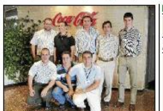
Equipo de fútbol 7 de Coladisa.

trabajo en equipo, la convivencia, la motivación y el espíritu de superación. Everis aporta un total de 63 participantes. La compañía desarrolla su actividad colaborando con las principales empresas en el desarrollo de alianzas a largo plazo.