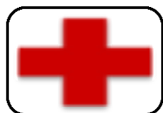
Cruz Roja (2005)