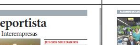
Los Juegos Interempresas completan su quinta edición en Valencia.

Se busca a la empresa más deportista Valencia acoge desde ayer la quinta edición de los Juegos Interempresas